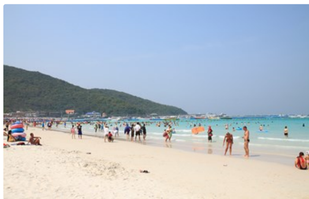
ดูรายละเอียดเพิ่มเติมที่