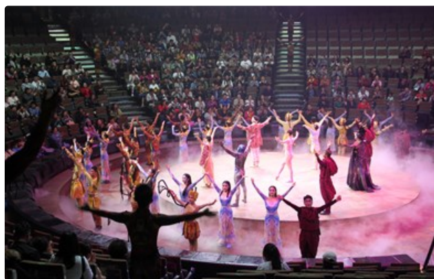
ดูรายละเอียดเพิ่มเติมที่