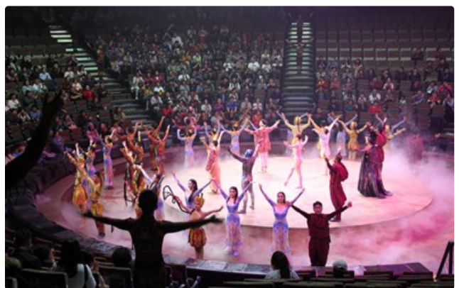
ดูรายละเอียดเพิ่มเติมที่