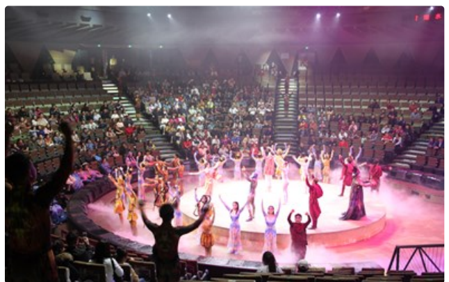
ดูรายละเอียดเพิ่มเติมที่